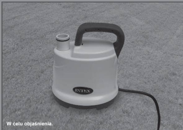
W celu objaśnienia.

Firma INTEX ma w swojej ofercie także: nadmuchiwane zabawki, artykuły plażowe, materace do spania, pontony, o które możesz pytać w miejscu zakupu tego basenu, a także w marketach i sklepach zabawkowych.